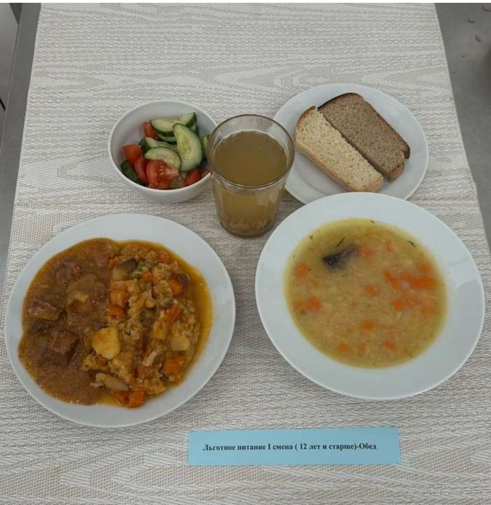
Льготное питание I смена ( 12 лет и старше)-Обед