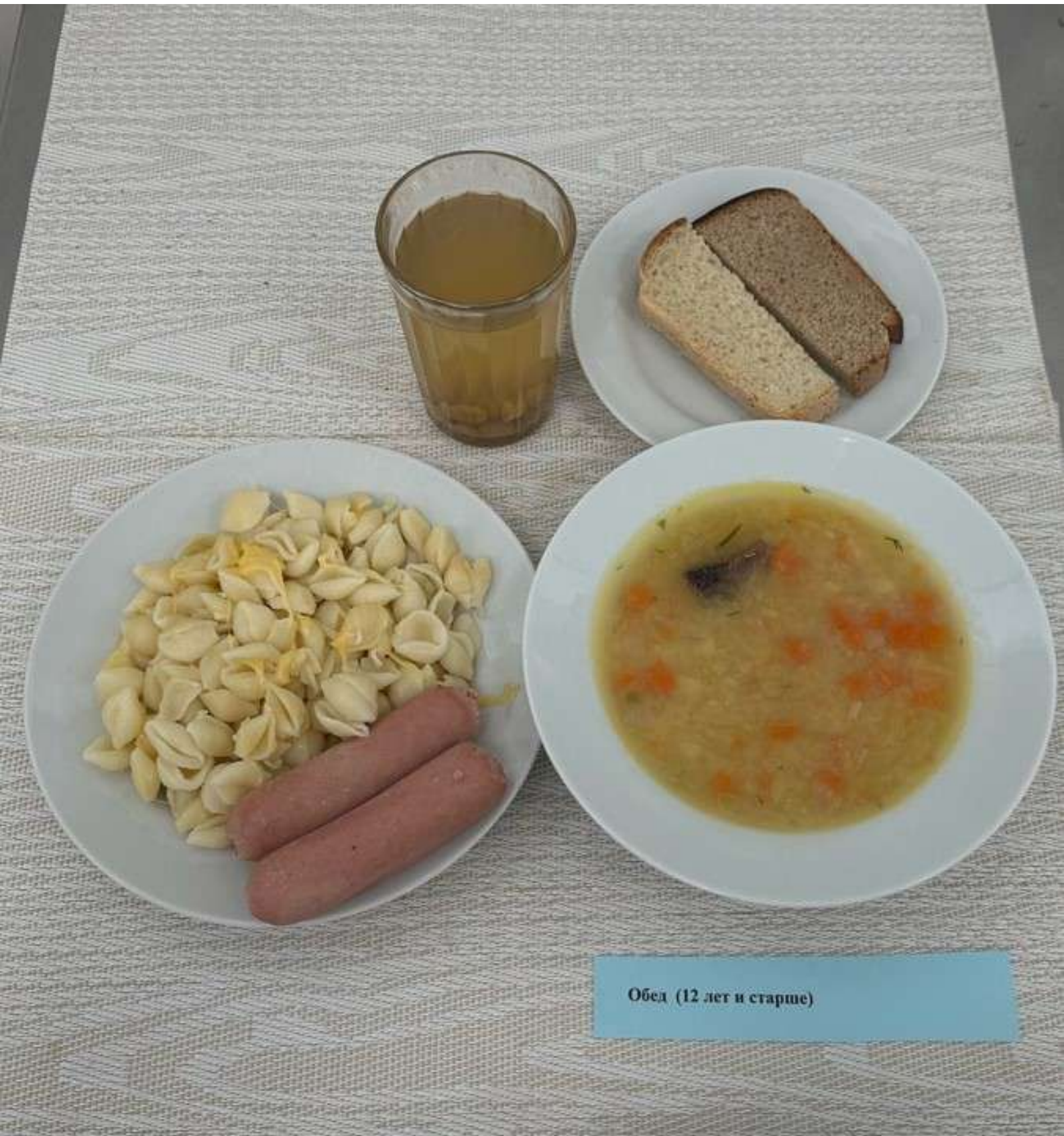
Обед (12 лет и старше)