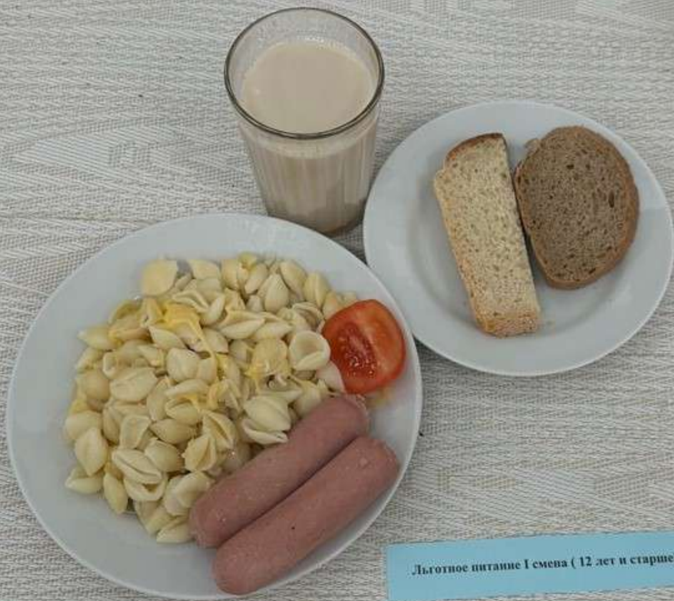
Льготное питание I смена ( 12 лет и старше)-Завтрак