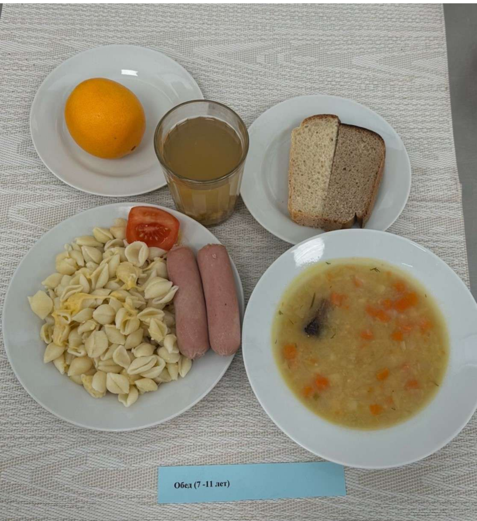
Обед (7 -11 лет)