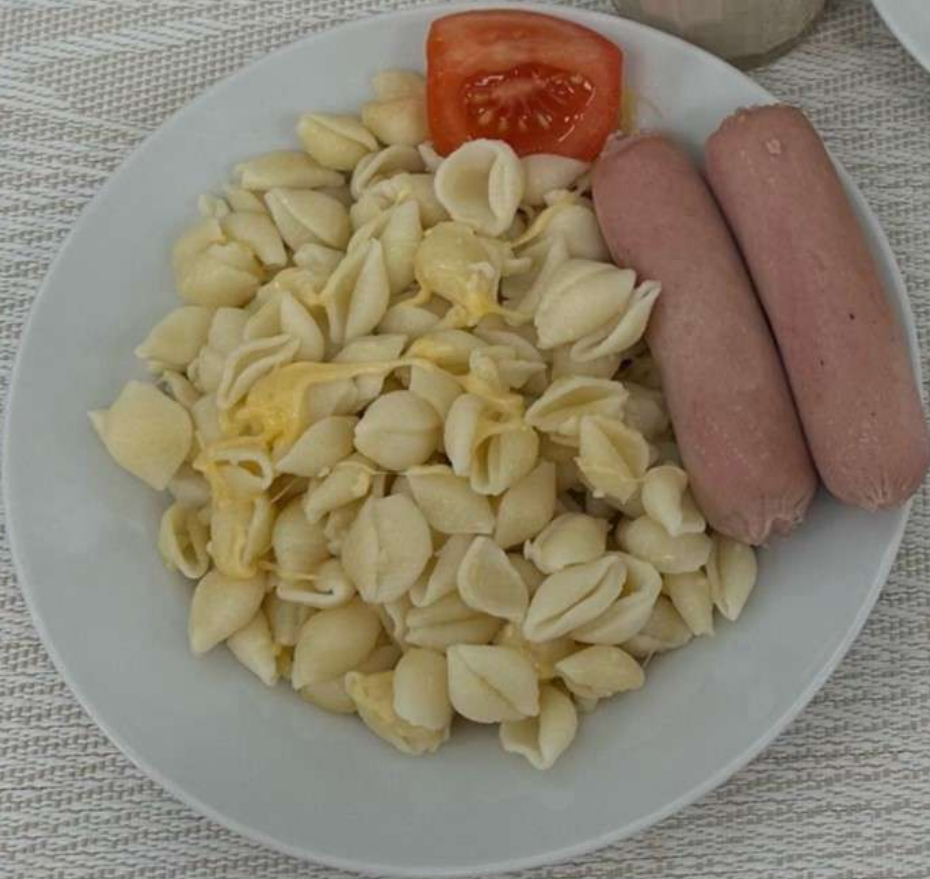
Завтрак (7 - 11 лет)