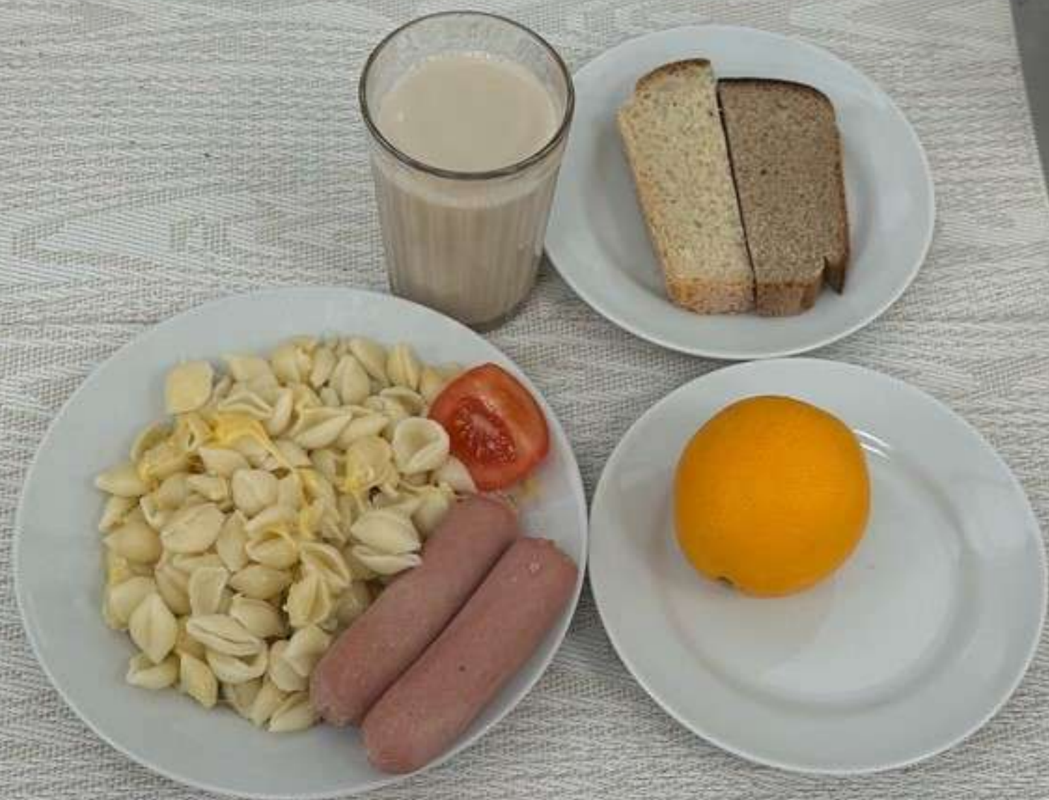
Льготное питание I смена ( 7 -11 лет)-Завтрак