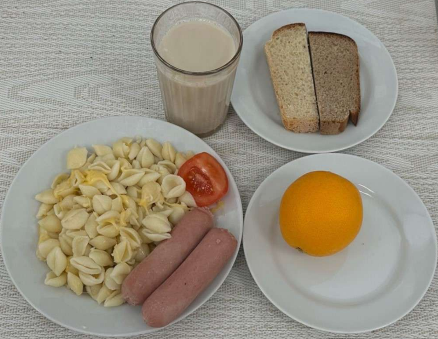
Льготное питание II смена (7-11 лет)-Полдник