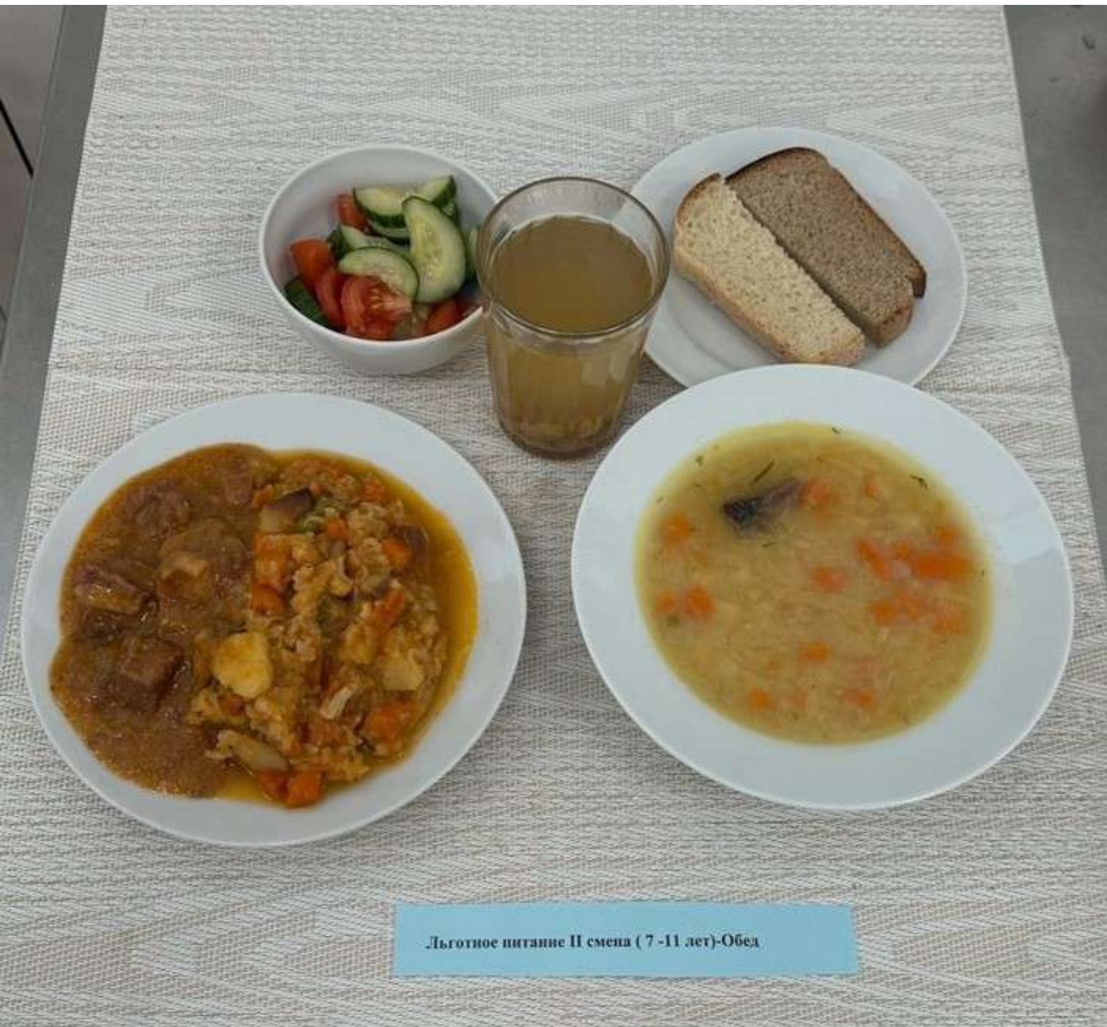
Льготное питание II смена ( 7 -11 лет)-Обед