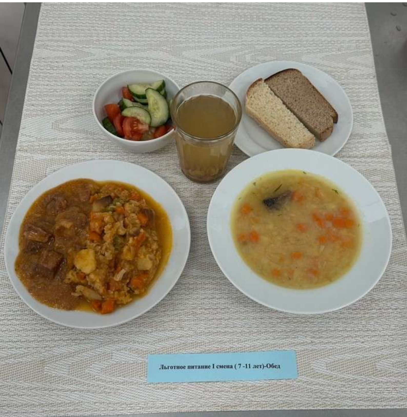
Льготное питание I смена (7-11 лет)-Обед