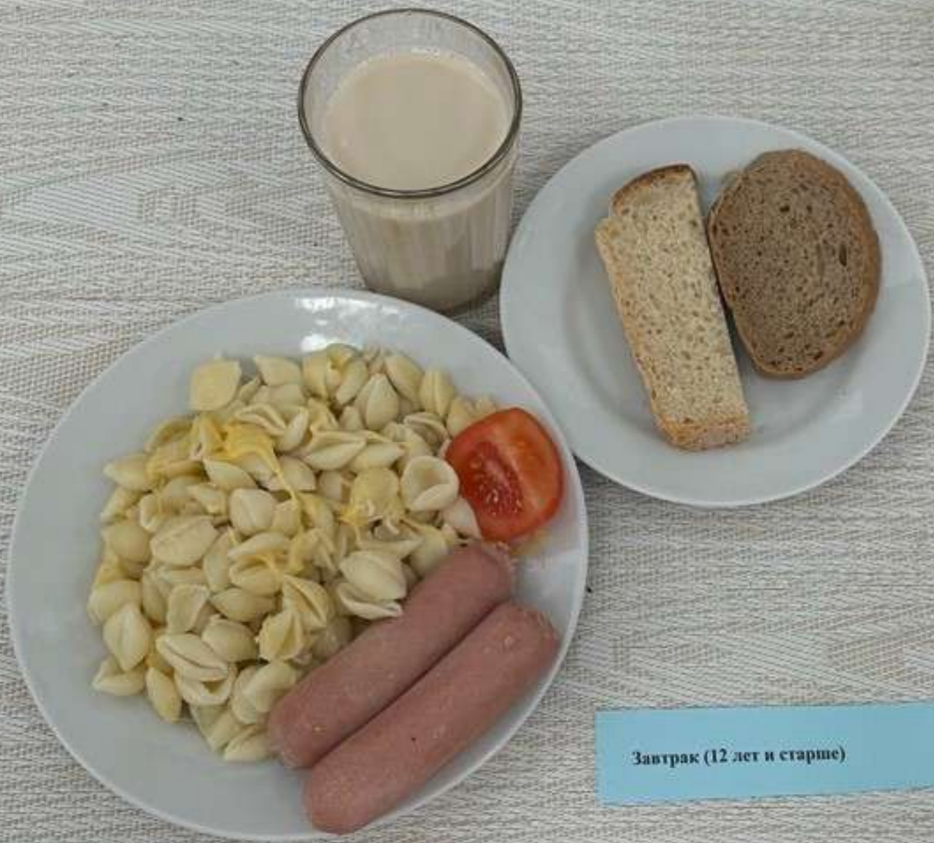
Завтрак (12 лет и старше)