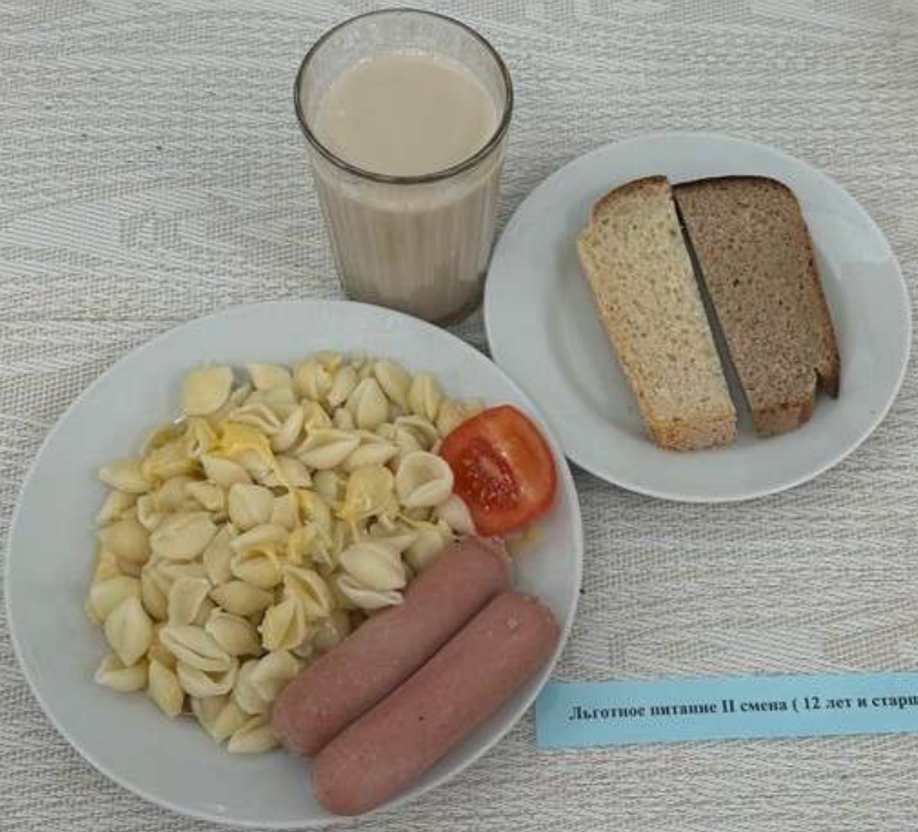
Льготное питание II смена (12 лет и старше)-Полдник