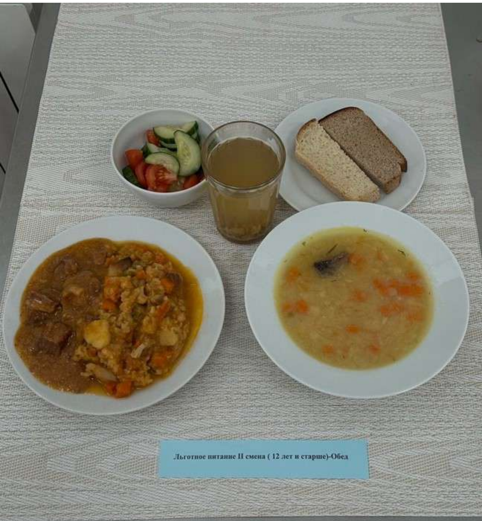
Льготное питание II смена (12 лет и старше)-Обед