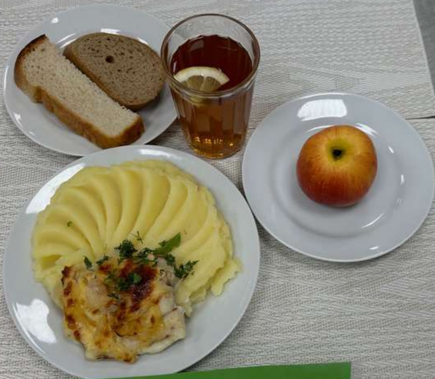
Льготная категория 1-4 класса (завтрак)