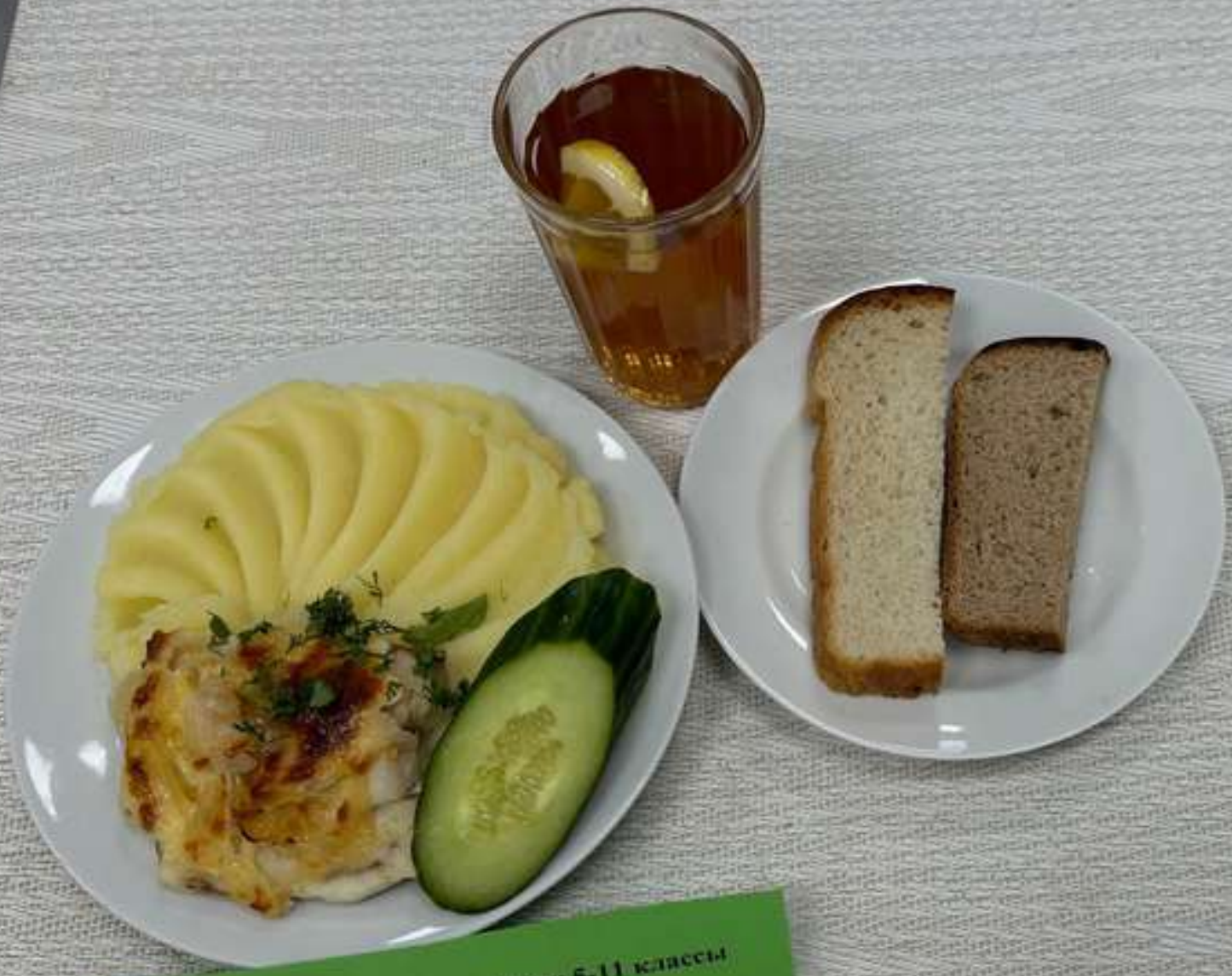
Питание за родителъскую плату 5-11 класеси