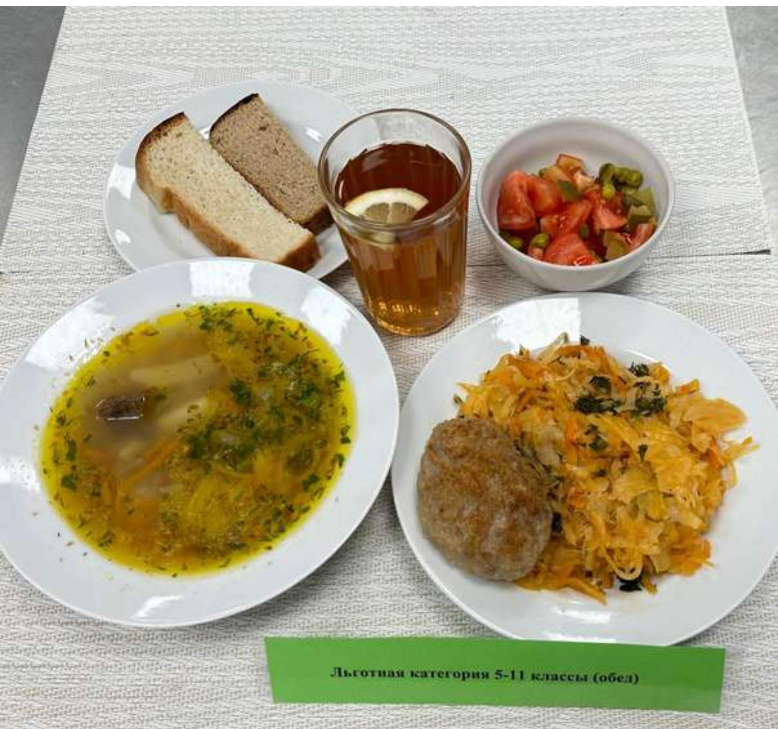
Льготная категория 5-11 классы (обед)