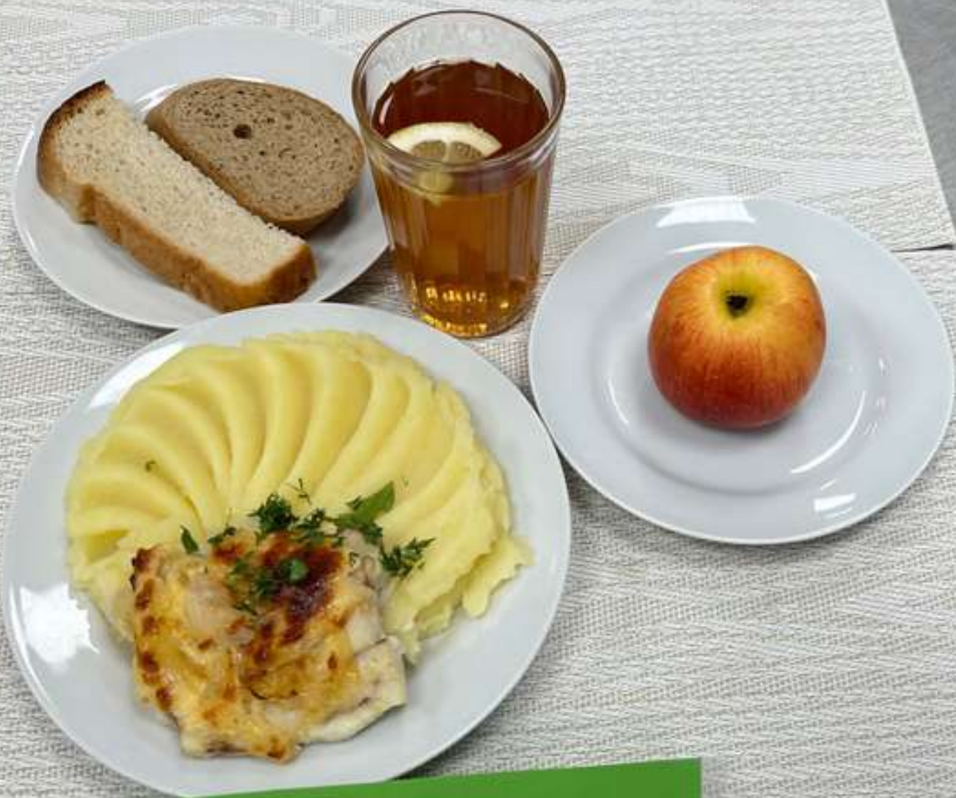
Льготная категория 5-11 классы (завтрак)