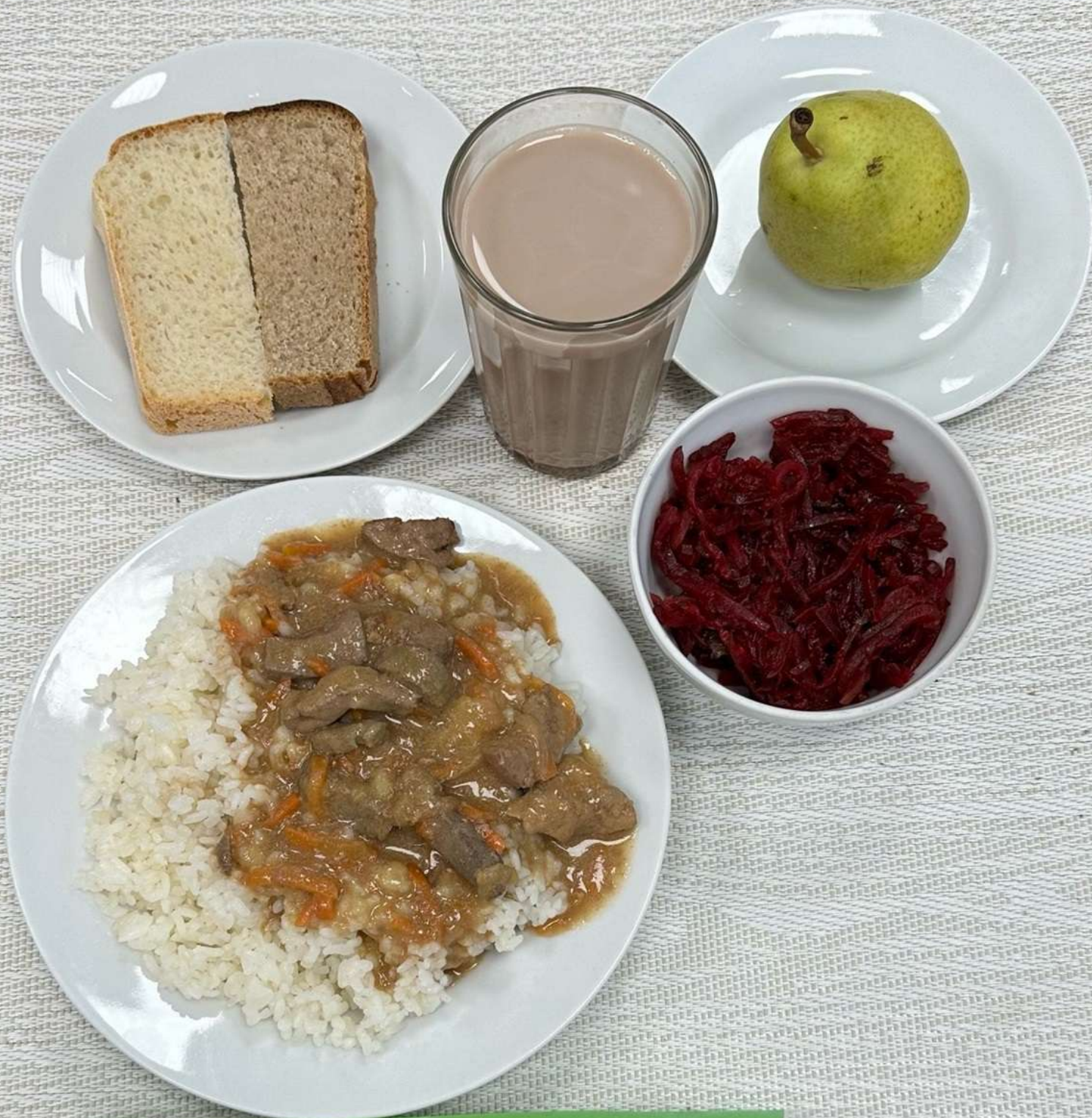
Льготная категория 1-4 классы (завтрак)