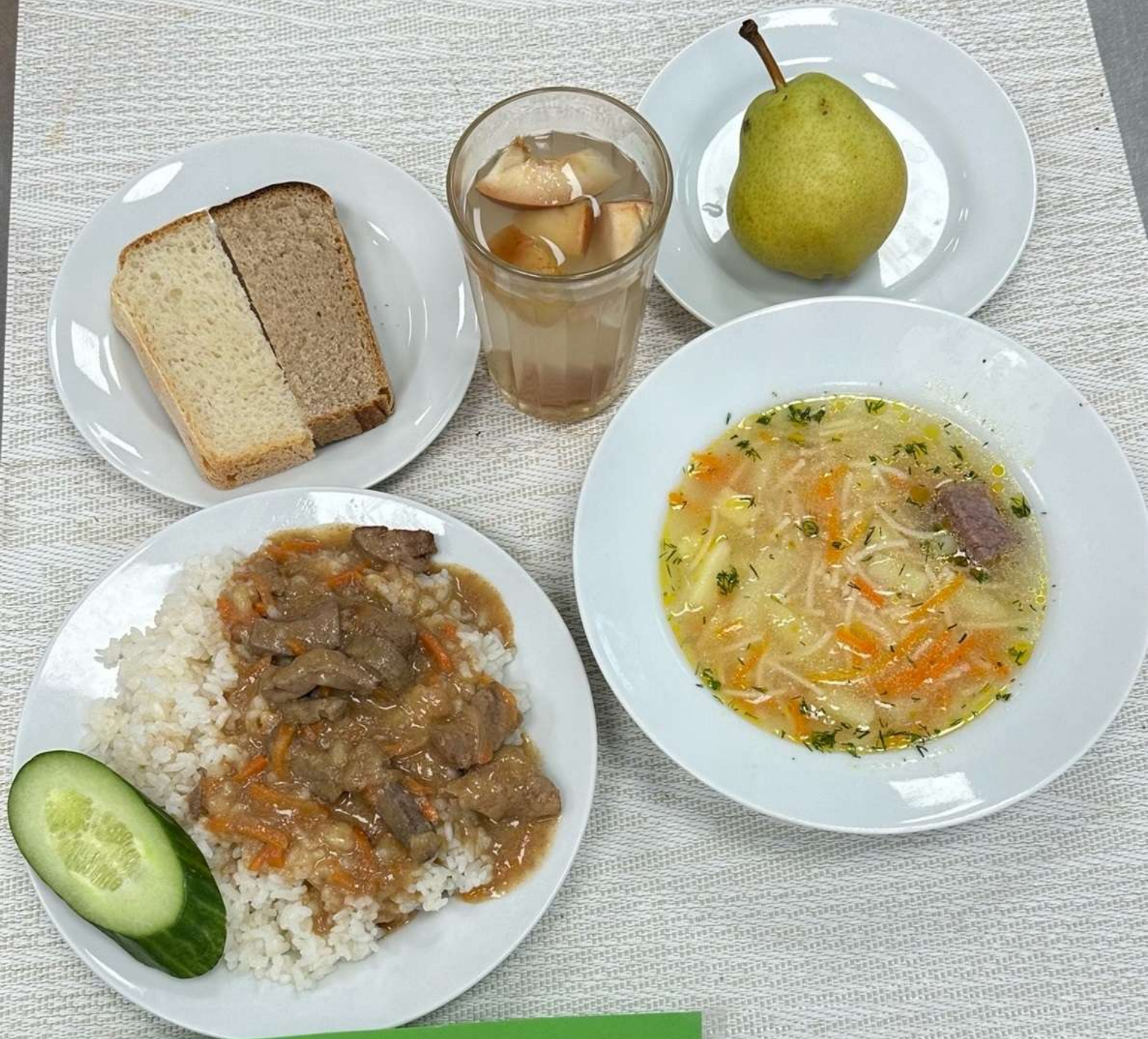
Льготная категория 1-4 классы (обед)