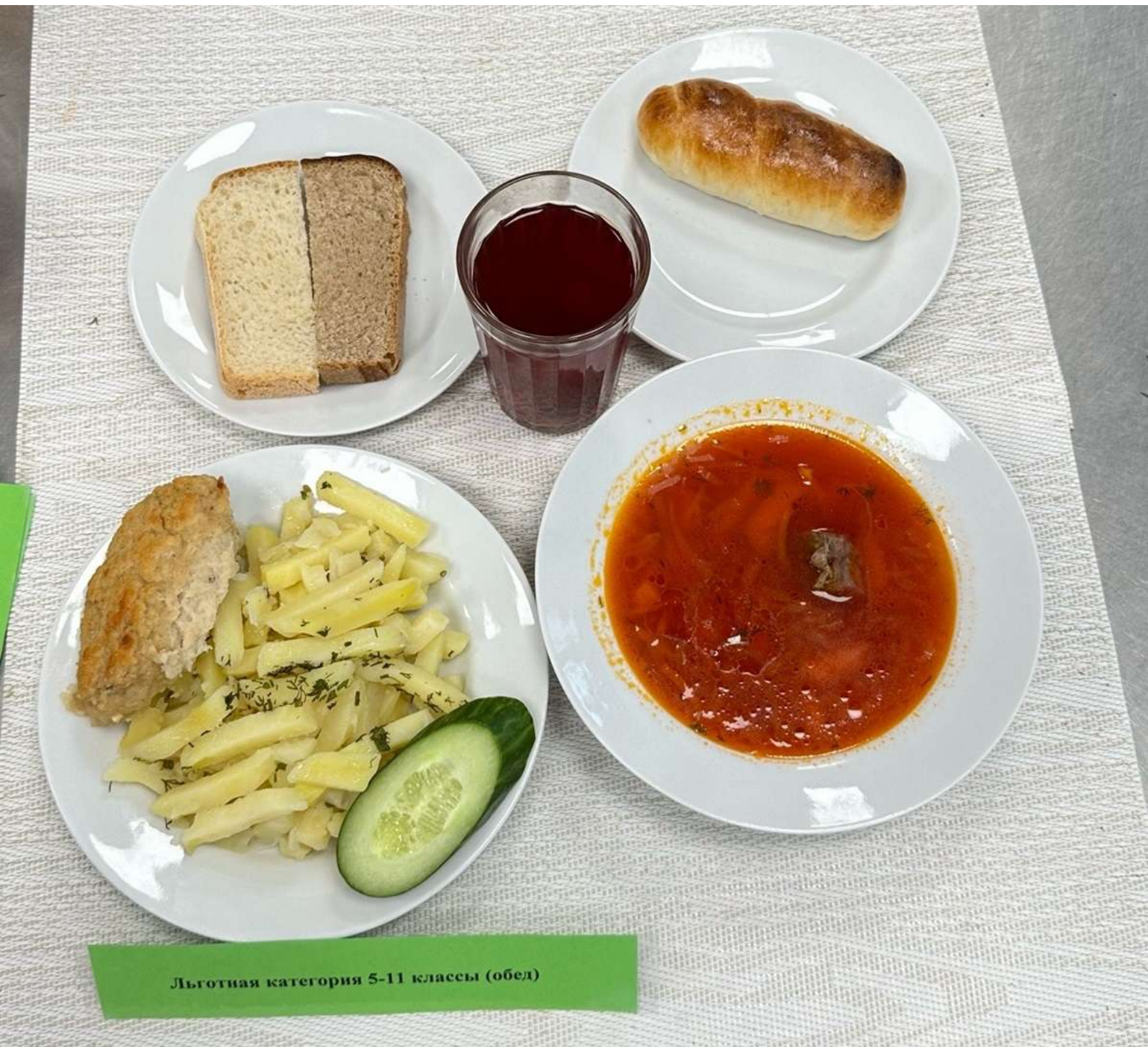
Льготная категория 5-11 классы (обед)