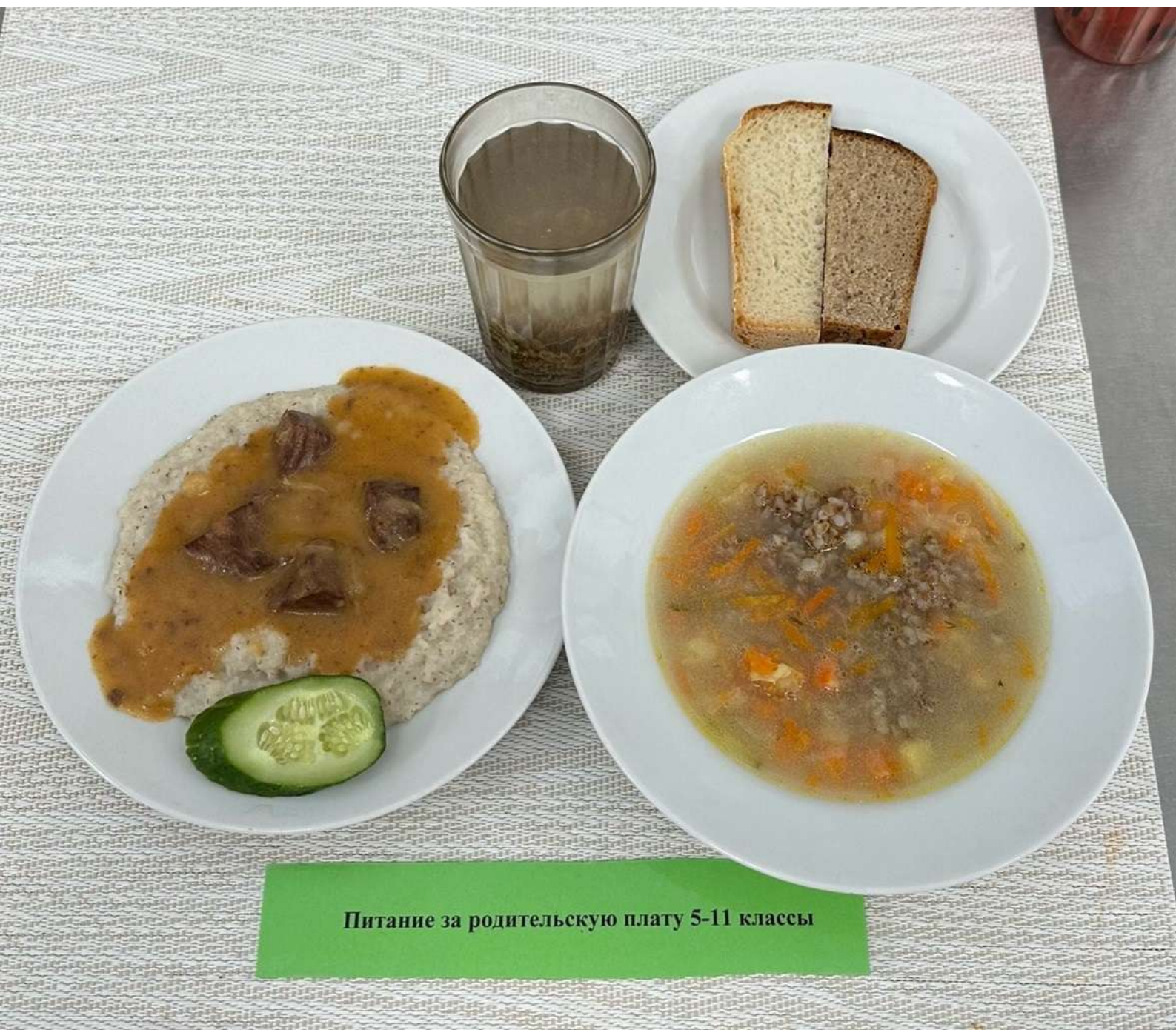
Питание за родительскую плату 5-11 классы