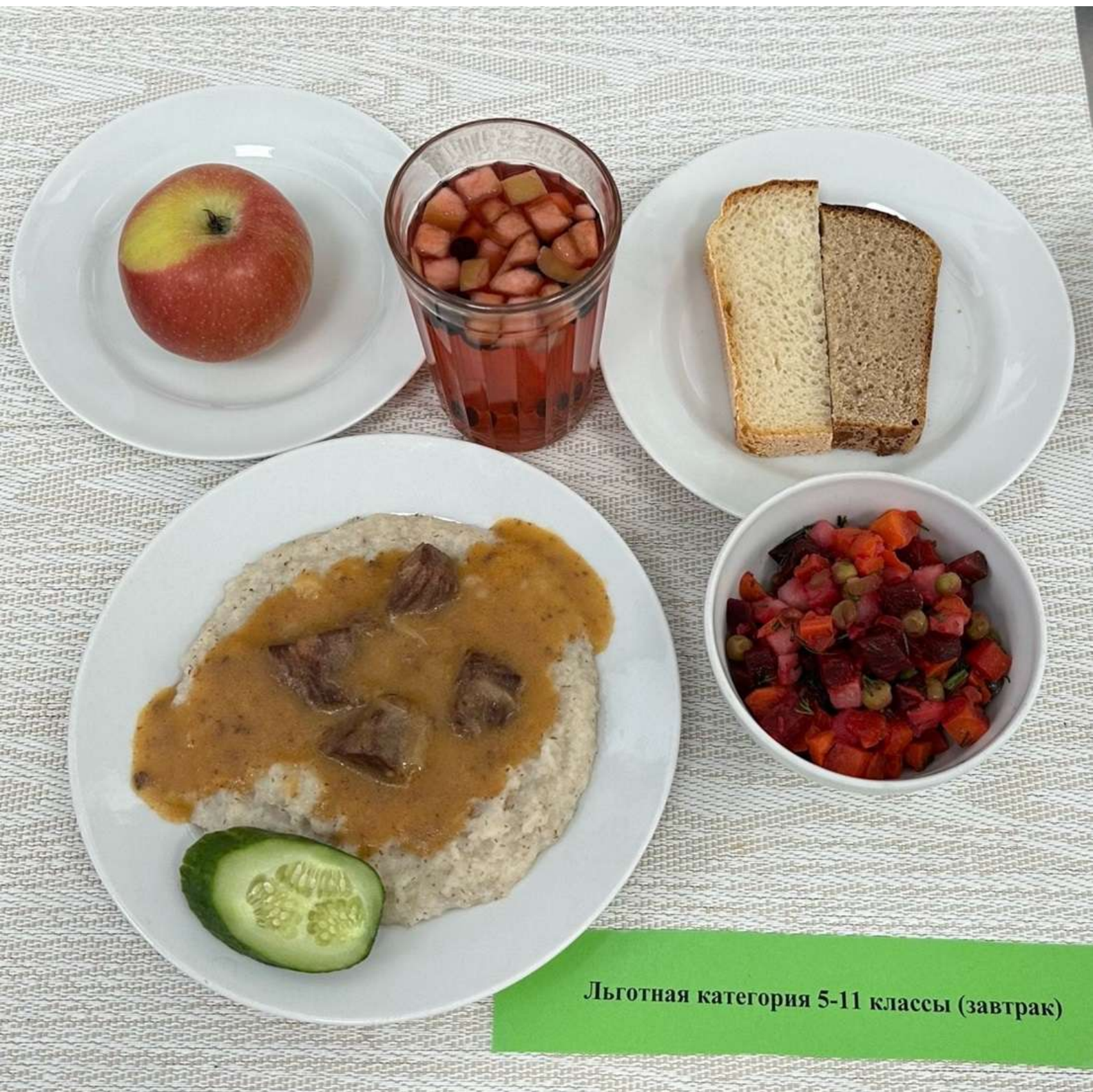
Льготная категория 5-11 классы (завтрак)