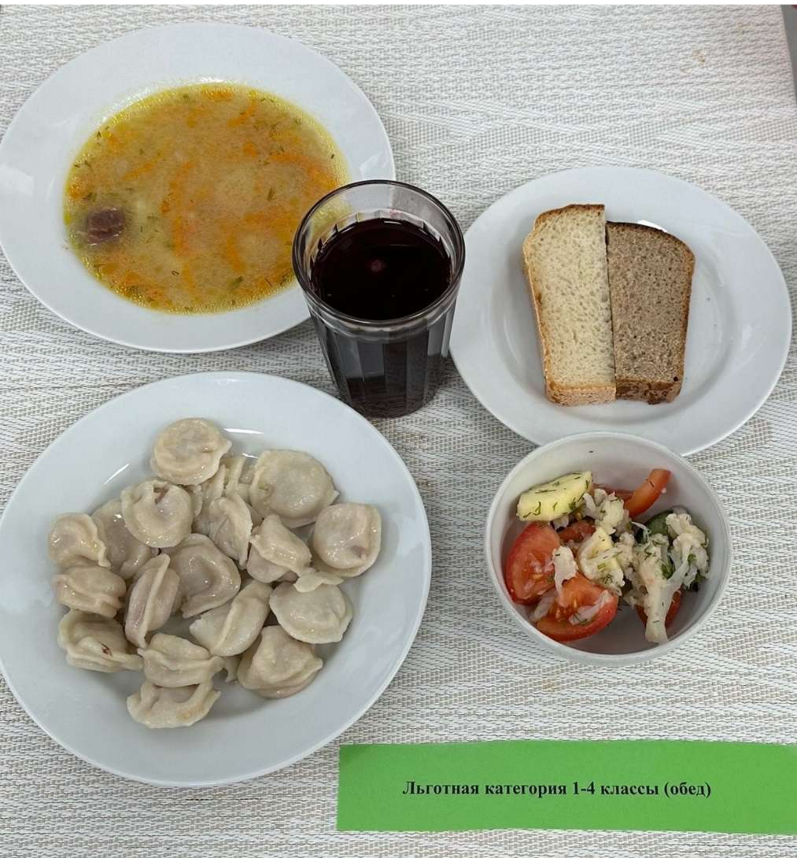
Льготная категория 1-4 классы (обед)