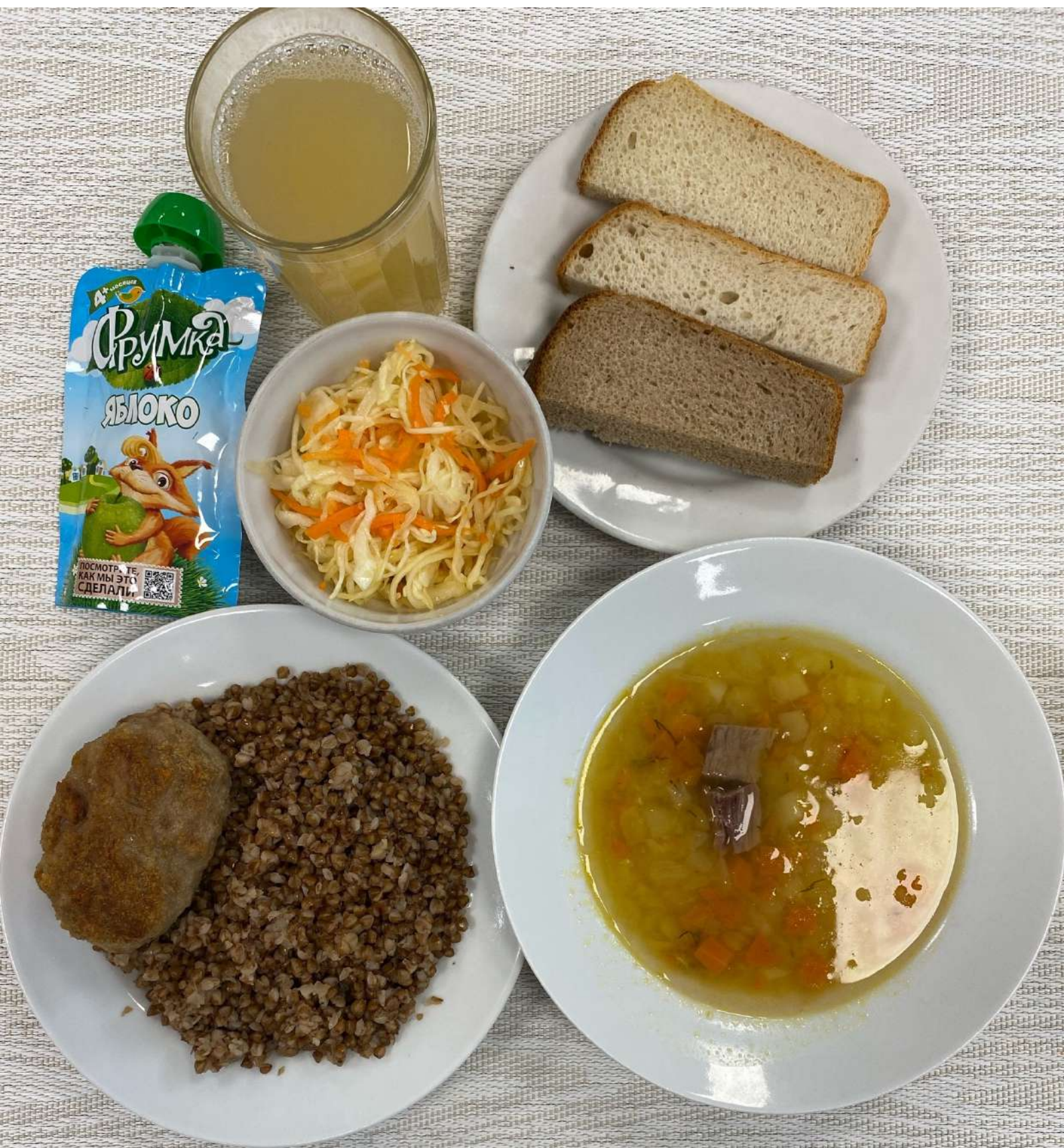
Льготное питание II смена (7-11 лет)-Обед