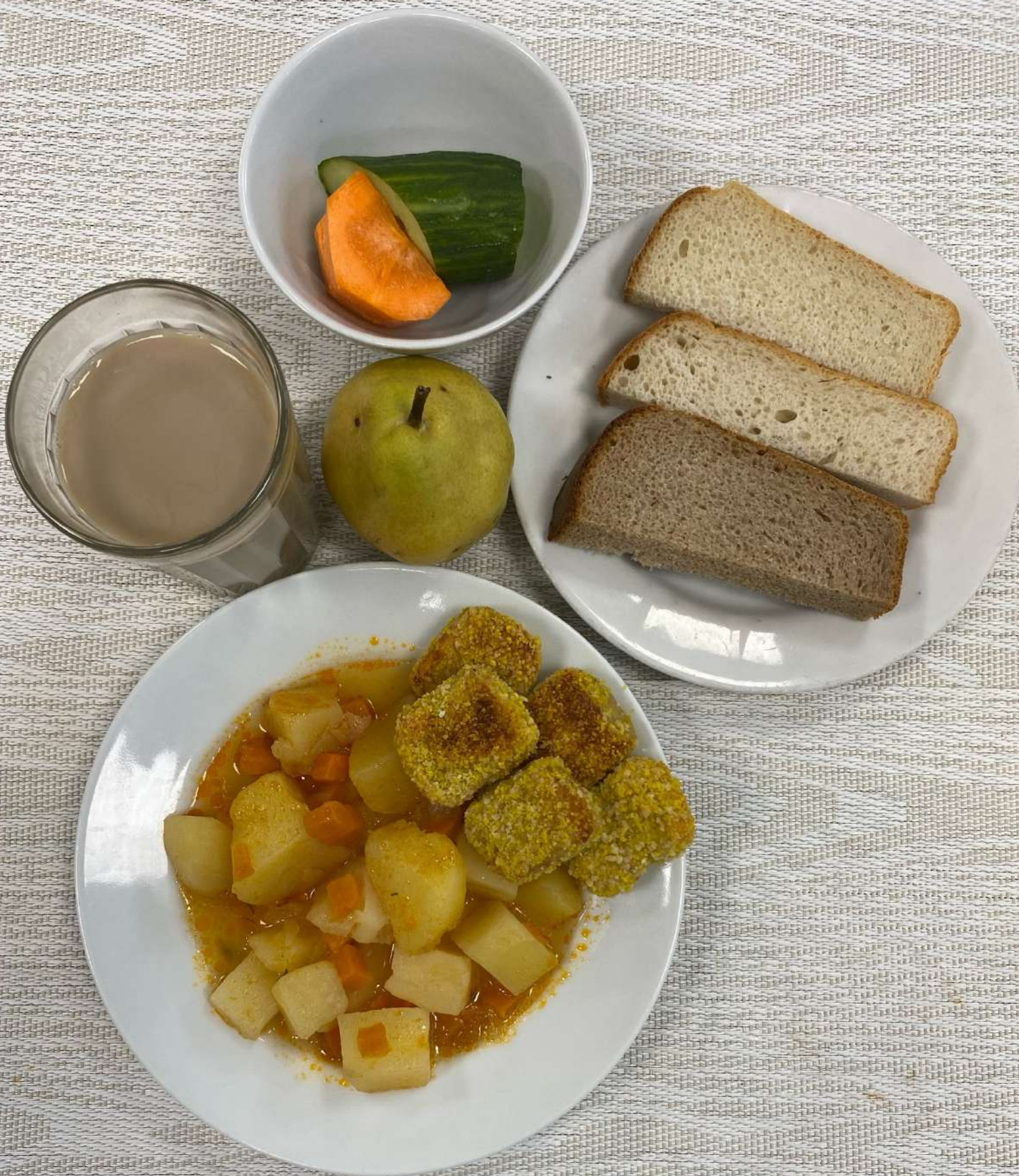
Льготное питание II смена (7-11 лет)-Полдник