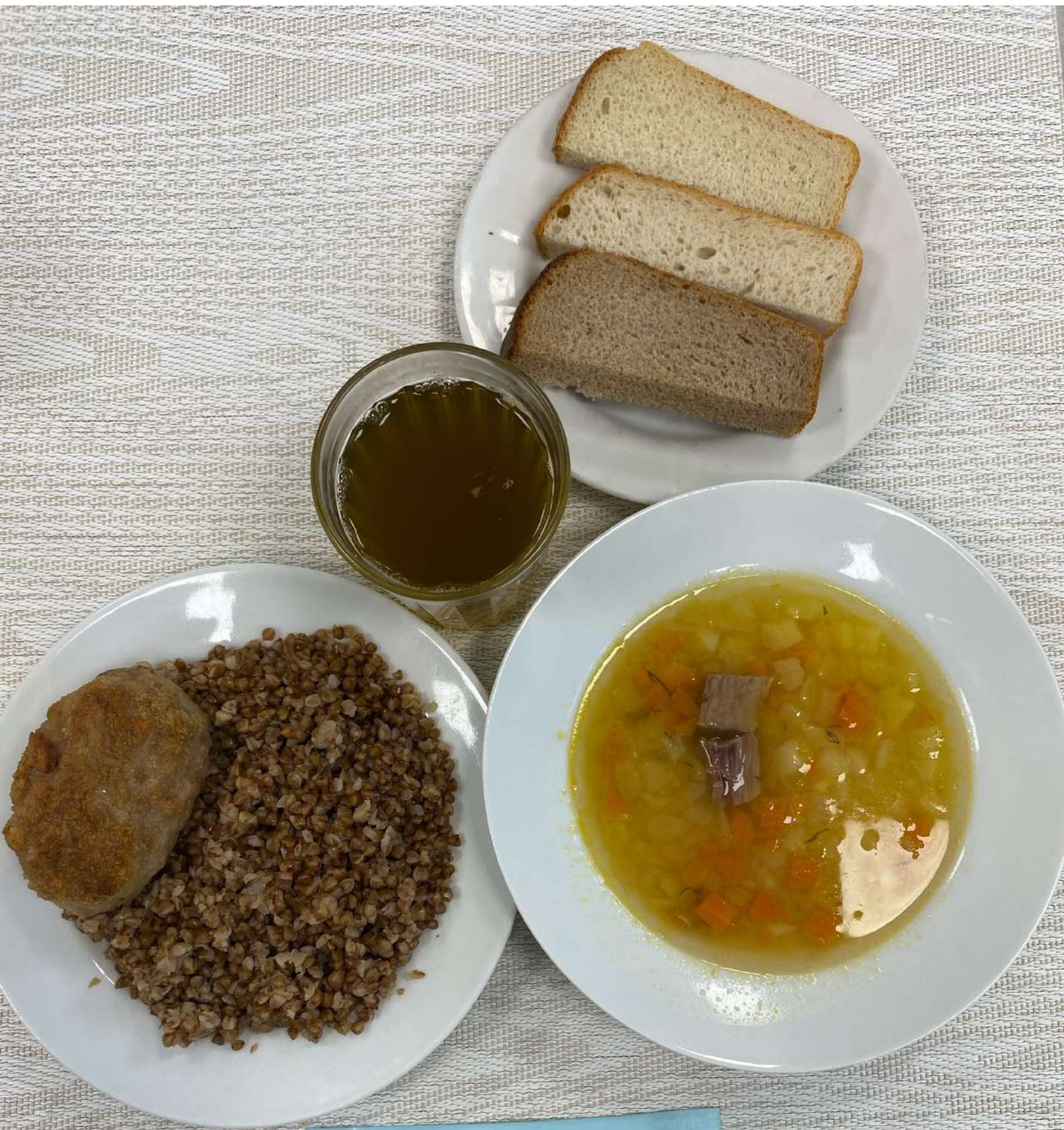
Обед (12 лет и старше)