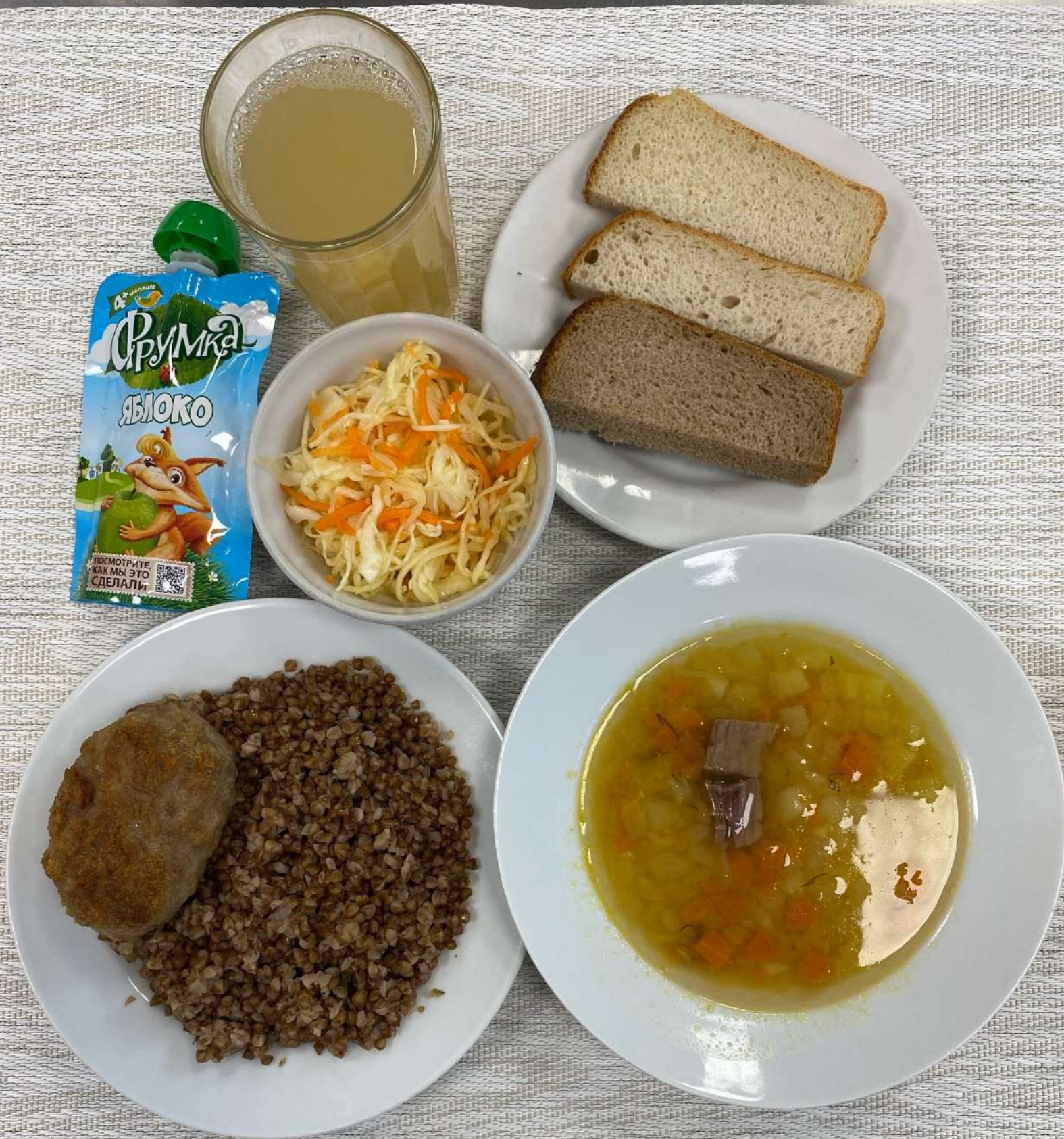
Льготное питание I смена ( 12 лет и старше)-Обед