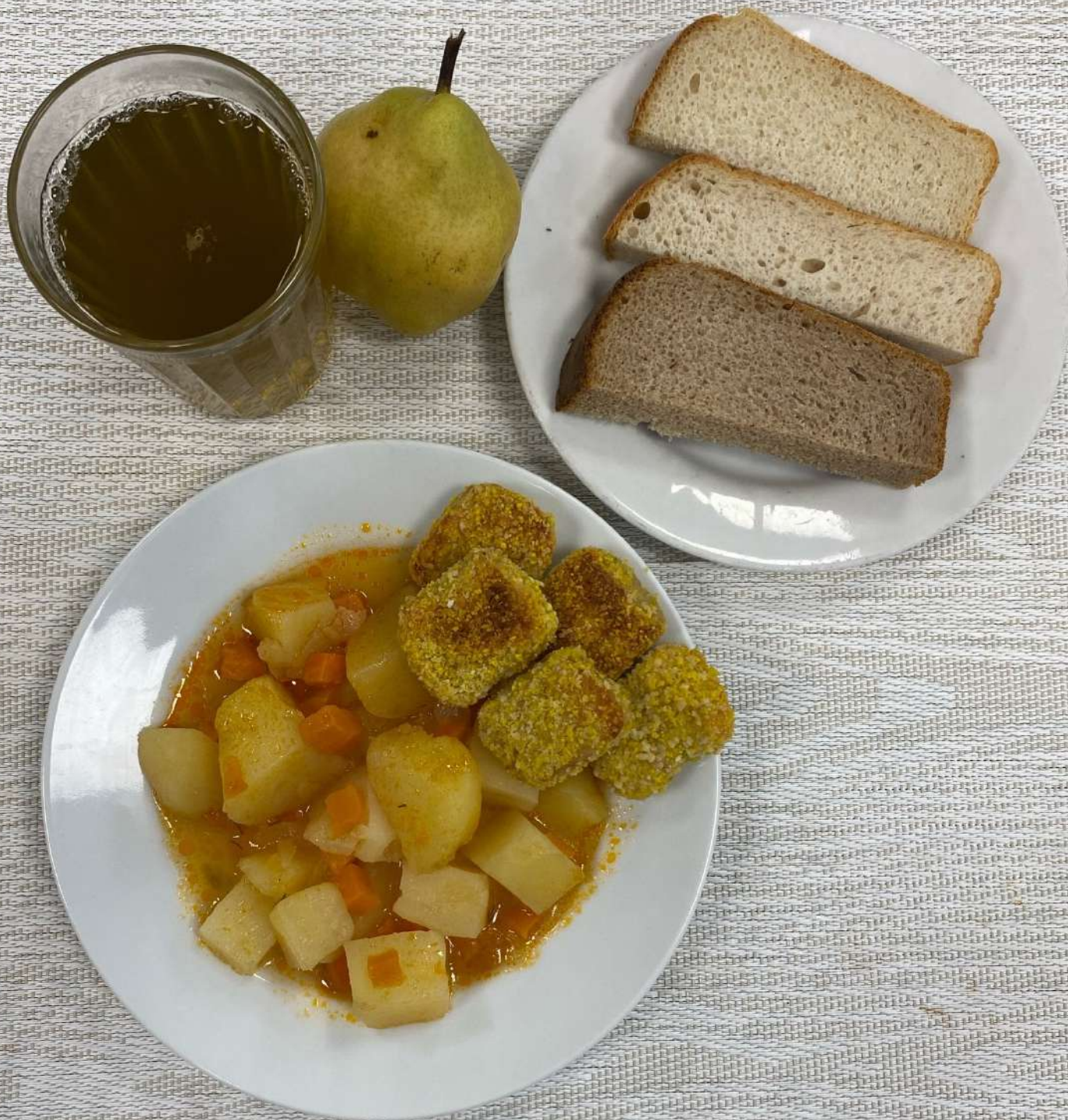
Завтрак (7 - 11 лет)