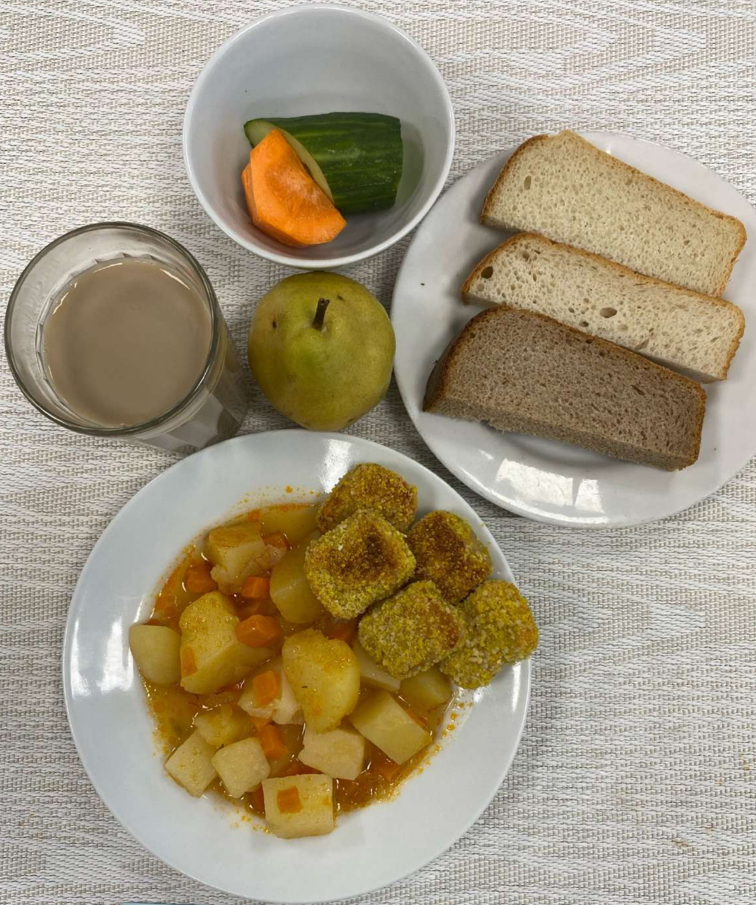
Льготное питание I смена (12 лет и старше)-Завтрак