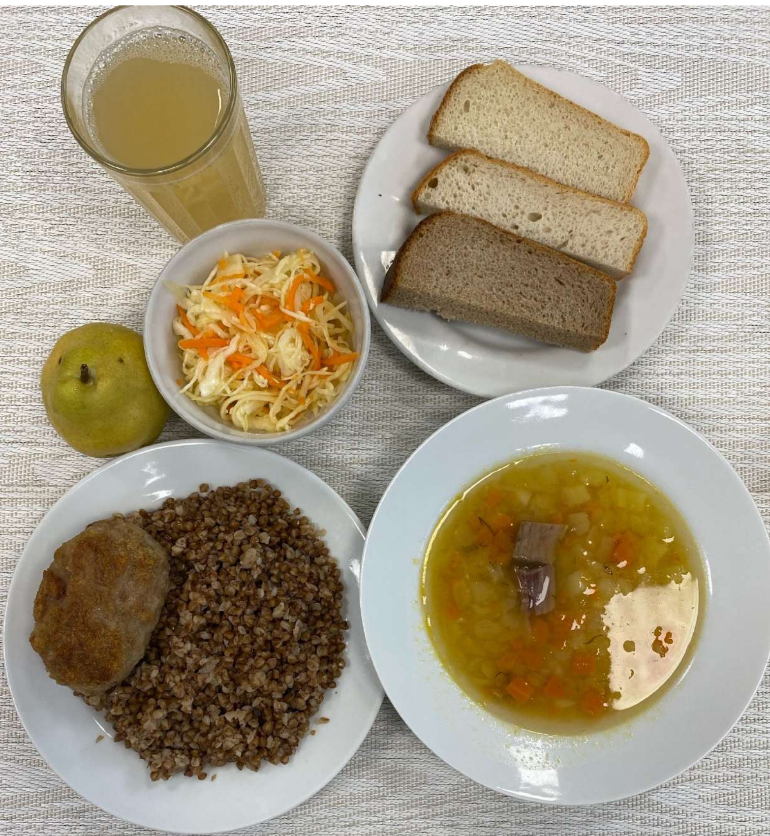
Обед (7 -11 лет)