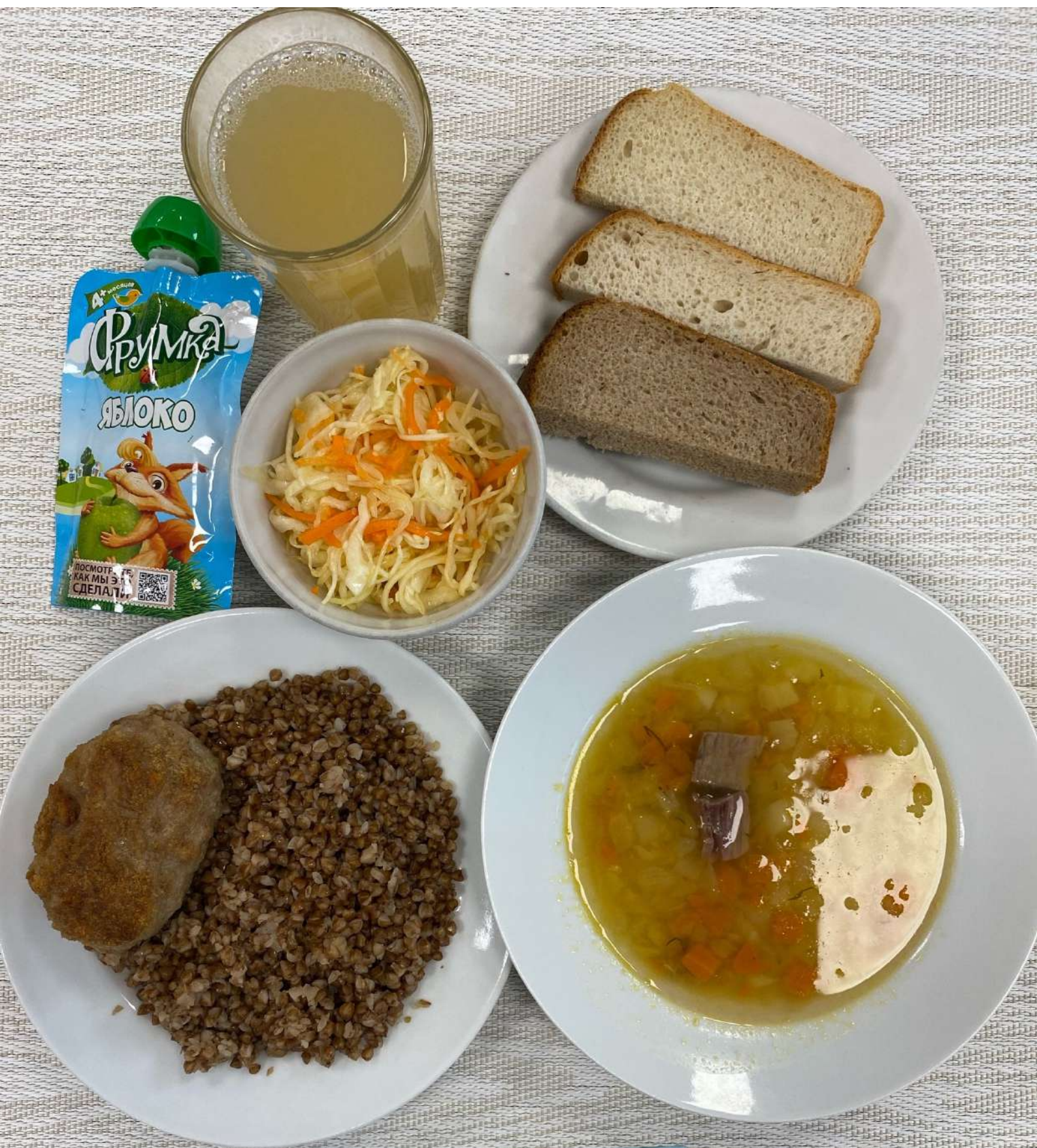
Льготное питание I смена (7-11 лет)-Обед