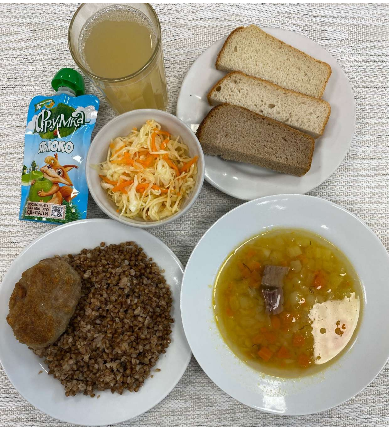
Льготное питание II смена ( 12 лет и старше)-Обед