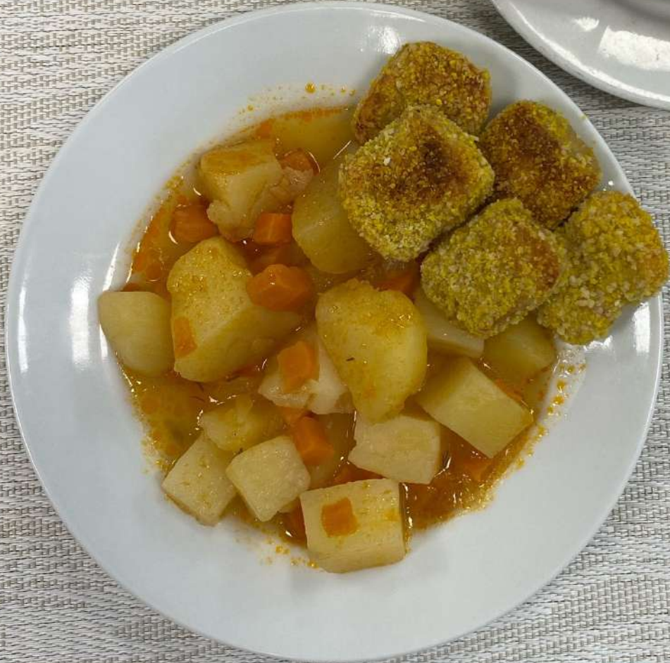
Завтрак (12 лет и старше)