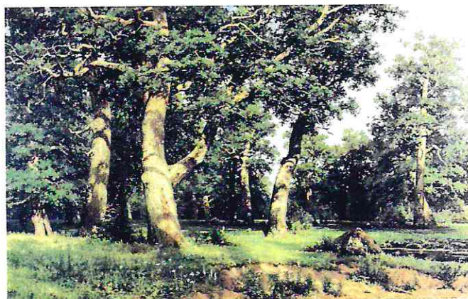
И. И. Шишкин. «Дубовая роща»