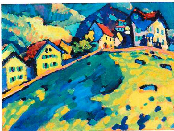
Кандинский В. В. «Летний пейзаж»